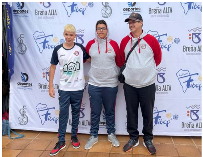
C.D. B.P. GEROD 18 FED. INS. Gran Canaria