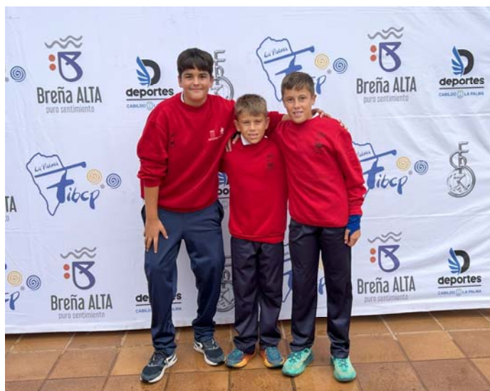
C. D. DE BOLOS NAZARET FED. INS. Lanzarote