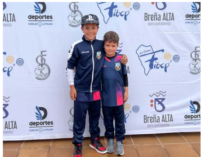
C.D. U.D. SOCORRO "B" FED. INS. Tenerife