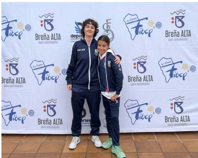
C.D. U.D. SOCORRO "C" FED. INS. Tenerife