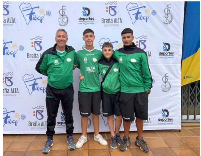
C.B.P. LOMITOS DE CORREA FED. INS. Gran Canaria