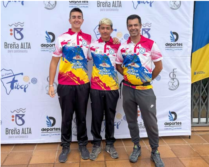
MIXTO EL CARMEN / ERA DEL CARDON FED. INS. Gran Canaria