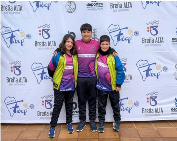
C. D. B.P. CASA AUGUSTO FED. INS. La Palma