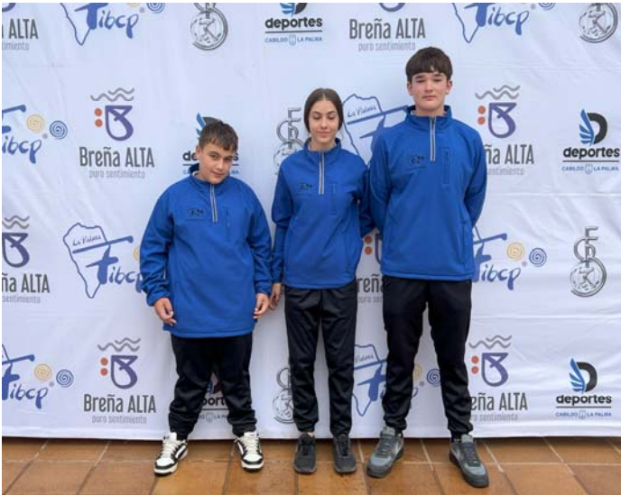
COMBINADO LA PALMA FED. INS. La Palma