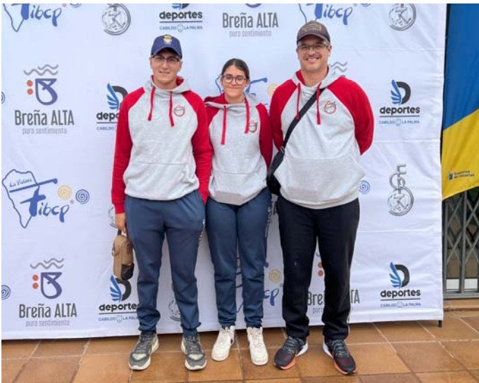
MIXTO STA MARGARITA / GEROD 18 FED. INS. Gran Canaria