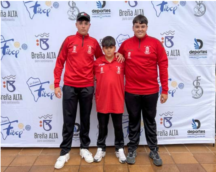
C.D. DE BOLA Y PETANCA AJEI FED. INS. Lanzarote