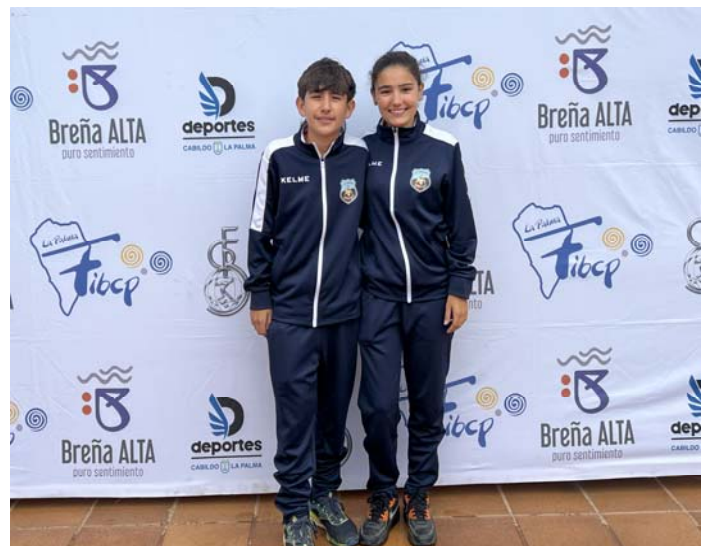
C.D. U.D. SOCORRO "A" FED. INS. Tenerife