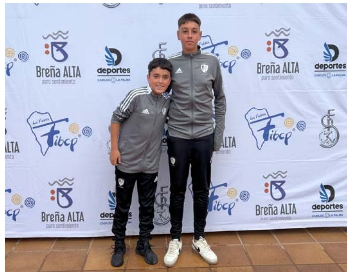
C.D. DE PETANCA ASOMADERO FED. INS. Tenerife